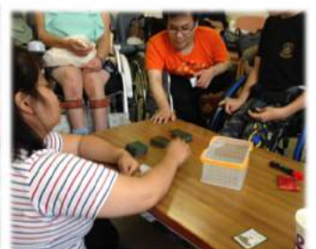
たまにはゲームもしよう