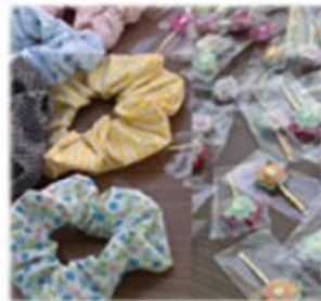
手作りシュシュ&ピン