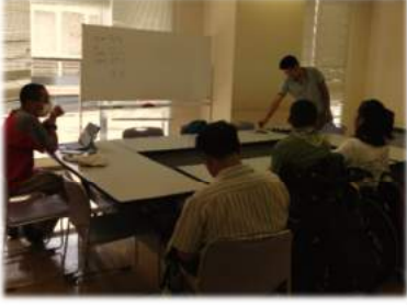
イベント企画の話し合い