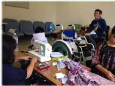
バザーでの品物作り